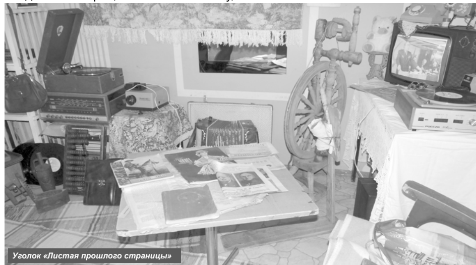
Уголок «Листая прошлого страницы»

Администрация Козыревского сельского поселения